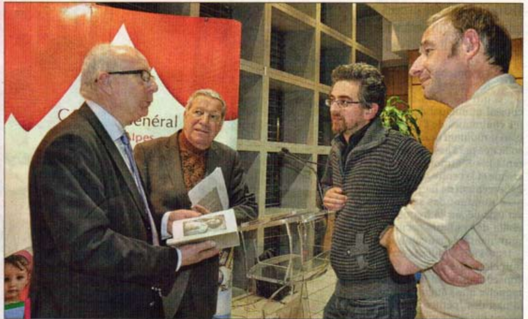
Le livre "Chaillol, portraits d'un festival" (éd. Aedam Musicae) a été présenté au Conseil général.

Comme les soirs de concerts, on retrouve dans le public des élus et des techniciens, des mécènes qui, au côté des collectivités locales et des grandes institutions de la musique, accompagnent le projet humain et territorial du festival. Il y a aussi les nombreux bénévoles de l'association, ces petites mains